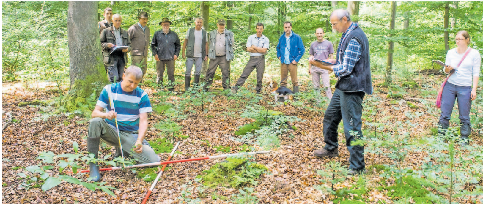
Vegetationsaufnahme im Rahmen des BioWild-Projektes im Schwarzbruch bei Eft-Hellendorf: Das übergeordnete Ziel des Projektes ist die Erfassung des Einflusses von Schalenwild auf die Pflanzenvielfalt und auf die Waldstruktur.

Der Beweis in der Praxis folgt. Vor schnappt sich den Detektor, der schlägt an allen vier Bäumen an. Zielgerichtet geht der Fachmann wieder auf den Punkt zu, an dem vor wenigen Minuten die beiden Roh-