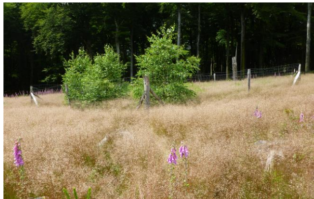
Nur im Zaun konnten sich Bäume gegen das Schalenwild durchsetzen.