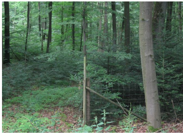
Außen Buchennaturverjüngung - innerhalb des Gatters junge naturverjüngte Weißtannen und Buchen.