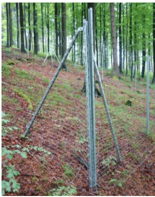
Der Eingangsbereich eines Weisergatters.