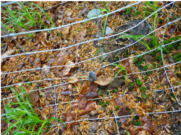
Die Absicherung des Knotengeflechts mittels eines Bodenankers.