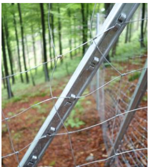
Das Knotengeflecht sollte wo immer möglich in den Pfählen eingehängt werden.