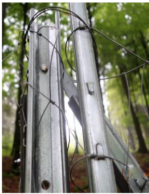
Der obere Eingangsbereich samt Absicherung zum Einhängen.