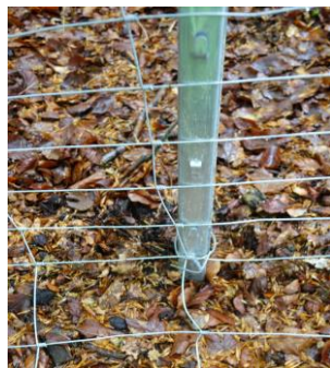
Der bodennahen Absicherung kommt eine Schlüsselposition zu.