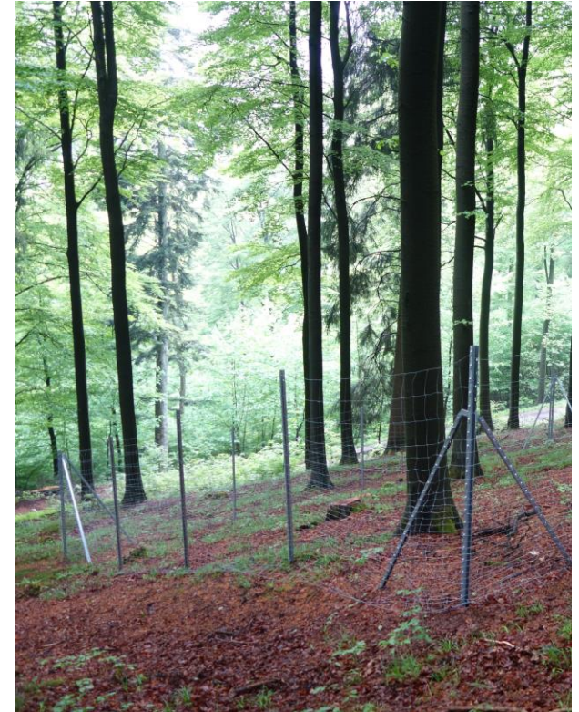
BioWild-Weisergatter in Schmallenberg, NRW.