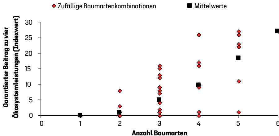
Abb. 2: Garantierter Beitrag zu den vier Zielen bei unterschiedlicher Anzahl an verfügbaren Baumarten. Zur Auswahl standen Buche, Eiche, Kiefer, Douglasie, Tanne, Fichte und Buche.